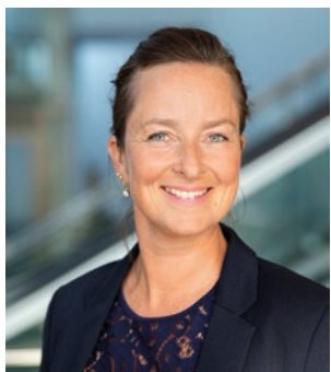
HELLE DAHLGREN / PROGRAMANSVARIG / PROJEKTLEDARE

E-post: klas.pettersson@svenskamassan.se